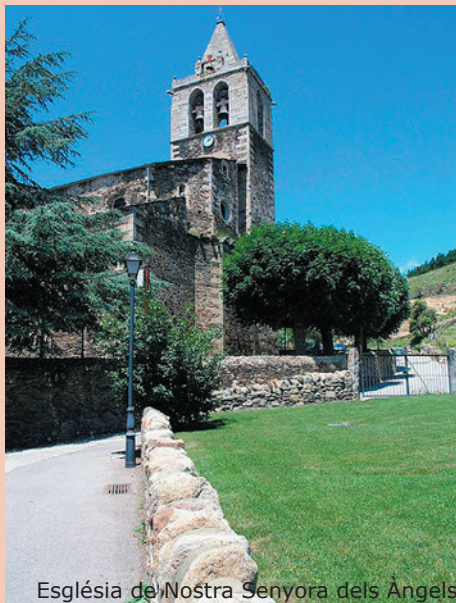
Església de Nostra Senyora dels Àngels

La darrera parada d'aquest recorregut per la història de Llivia fa referència al Tractat dels Pirineus. Situada a la plaça Major, hi arribarem a través dels carrers Pujada de l'Església i Frederic Bernades.