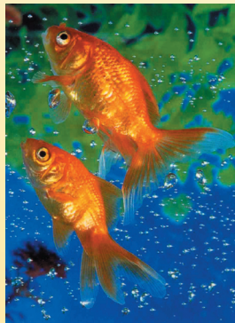
Un aqüari al nord ajuda la carrera professional

EL NORD: El nord representa la nostra carrera professional. També els nostres canvis en la orientació laboral i les decisions que anem prenent durant la nostra vida respecte a la nostra feina. És important que els objectes de decoració que hi posem simbolitzin les nostres aspiracions, o si més no, que es presenti cap a on volem anar. Un exemple, tenir un quadre amb una mar brava i furiosa en aquesta zona predisposa a una feina sempre trepidant i amb conflictes, en canvi, un riu que corre plàcid i tranquil simbolitza una vida professional calmada i satisfeta. El nord també, és el punt cardinal de l'element aigua. Harmonitzen aquest sector amb aquaris, fonts, formes ondulades amb el color blau o negre com a dominant.