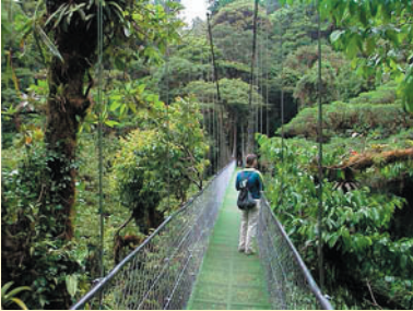
Potenciar aquest sector pot ajudar a fer realitat un viatge de somni

Es tant important (o més!) com potenciar aquesta zona no posar-hi res que simbolitzin tristor, soledat o pobresa. Si el wc està situat al nord-oest mirarem de tenir sempre la tapa tancada. No hi posarem elements que evocuin el vent, perquè simbòlicament faríem marxar els clients.