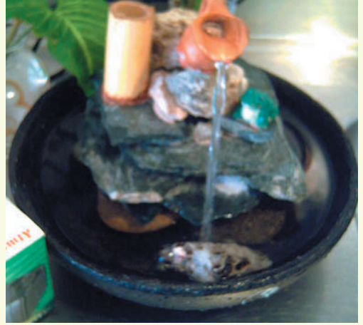
Aigua en moviment en el sector Sud-Est és un bon estímul per a la nostre prosperitat material. Però sempre ha de ser aigua en moviment.

Resulta molt beneficiós posar-hi un petit estanys o font amb aigua en moviment, amb peixos de colors. També es pot potenciar amb objectes de fusta, plantes i tota mena de representacions de riquesa.