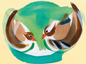
Una parella d'ànecs mandarins son un símbol d'amor i matrimoni.

Els colors son el rosa, el blanc, els colors pastel. Les espelmes també estan indicades per a aquesta zona, les flors (millor les peonies i magnolies).